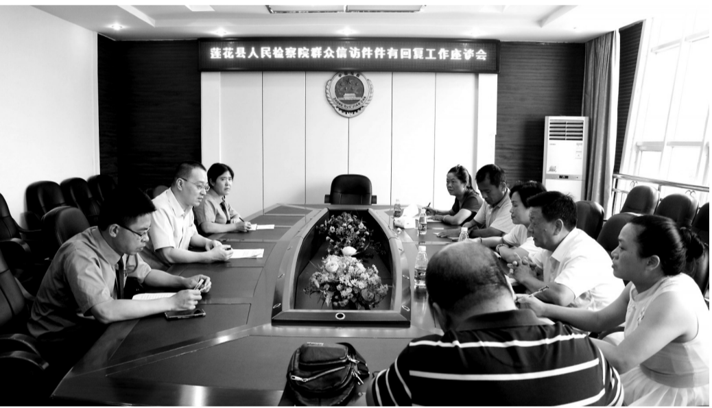
近日,莲花县检察院举行“检察开放日”活动,邀请人大代表、政协委员、人民监督员等走进检察院,详细了解检察机关12309检察服务工作。座谈会上,与会人员对新时代检察工作提出了意见和建议。

今年4月,小婷(化名)到法院提起离婚申请。小婷说,丈夫打人、砸东西,自己一直生活在极度恐惧中,她请求法院禁止丈夫伤害自己及家庭成员人身安全。法庭经审查认为,申请人小婷曾陈述在