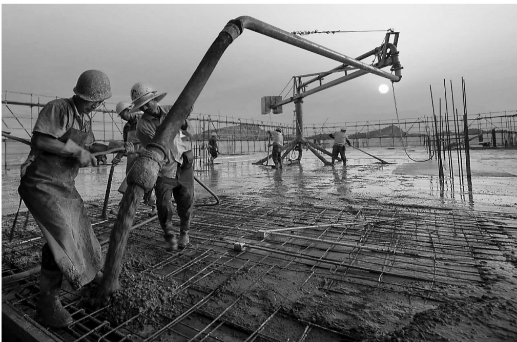
近日,湘东区中医院整体搬迁项目现场,一派热火朝天的施工景象。该项目占地90.36亩,建筑面积8万平方米,设置病床790张,总投资4.8亿元。项目自去年6月开工以来,截至今年6月15日,累计完成投资约1.3亿元,建筑工程任务完成45%。