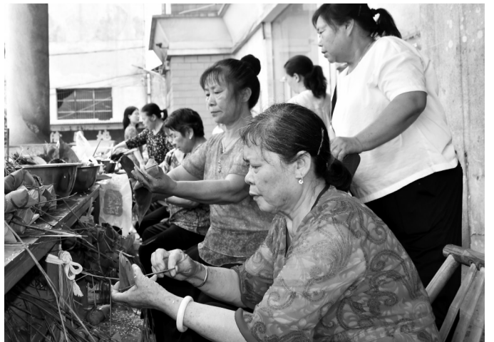
近日,白源街源壁村新时代文明实践站举行“共度端午,齐奔小康”扶贫扶志主题活动,帮扶干部和建档立卡贫困户齐聚一堂进行包粽子比赛。