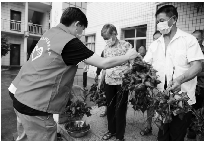
近日,新泉乡机关红色连心服务队志愿者来到新泉敬老院,为老人们送上粽子,陪老人们过端午节。